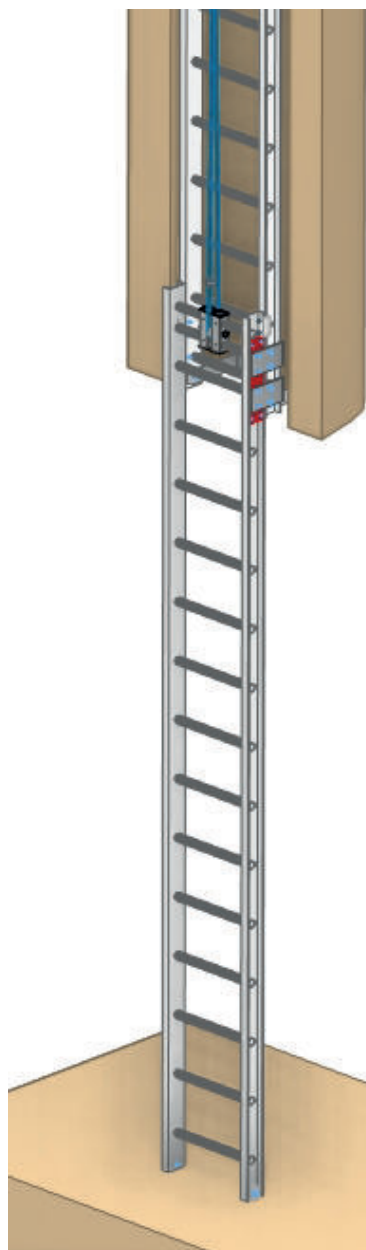
Position Basse :